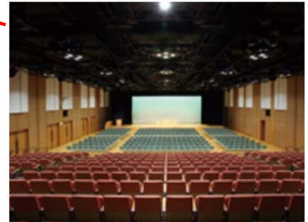
▶ コンベンションホール